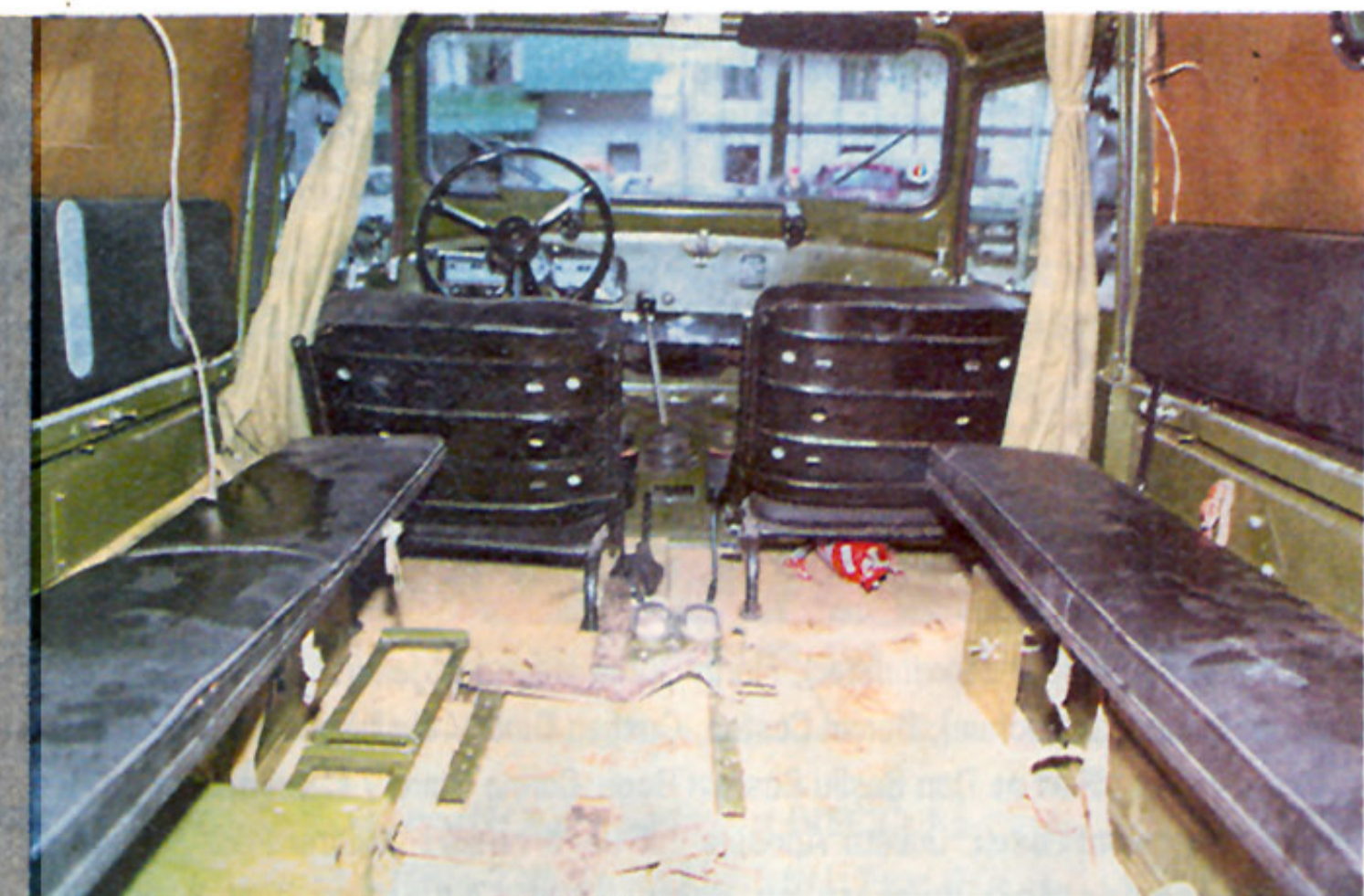
Interiorul spartan poate găzdui 8 pasageri